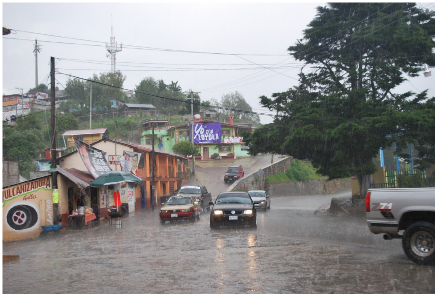
In der Regenzeit kann sich innerhalb einiger Minuten die Straße in einen Fluss verwandeln.