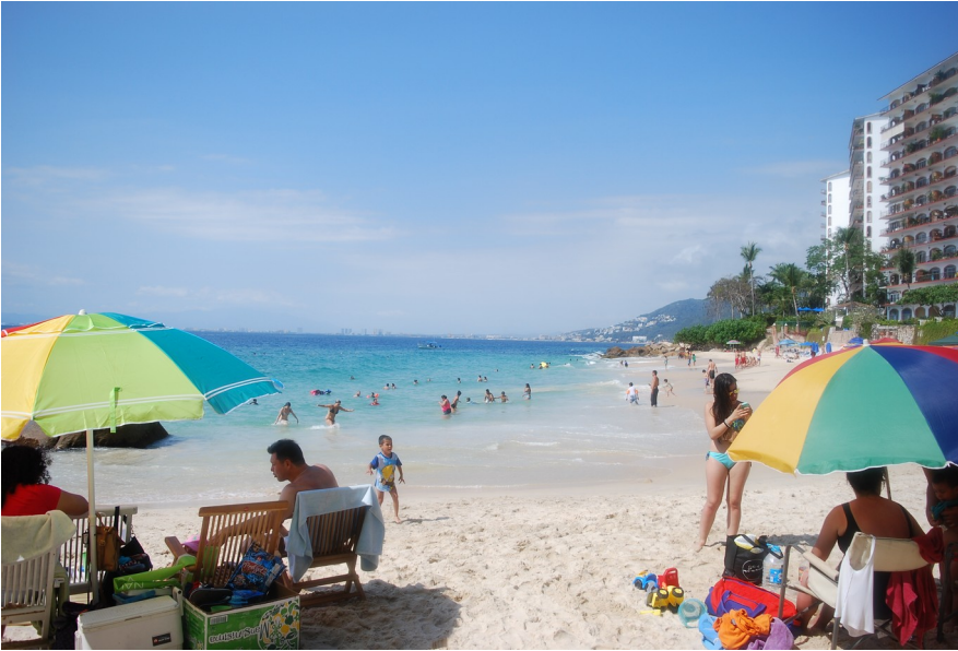
Die Strände Puerto Vallartas, vergleichbar mit denen Cancuns oder Mallorcas, zumindest was die Strand- und Urlaubskultur betrifft.